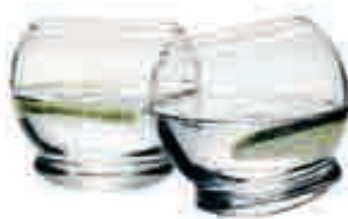
ROCKING GLASSES >