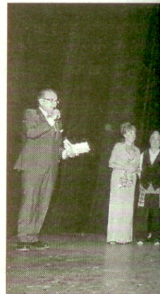
Los artistas, al final de la gala.

■ Los valencianos se sienten más orgullosos. La Comunidad Valenciana se repleta durante el primer aniversario de la autonomía de España. Los valencianos, por detrás de los catalanes, el Instituto de Política Familiar y el Ministerio de Hacienda, respectivamente, se repleta cuando se rompe una pareja en la Comunidad debido a la crisis.